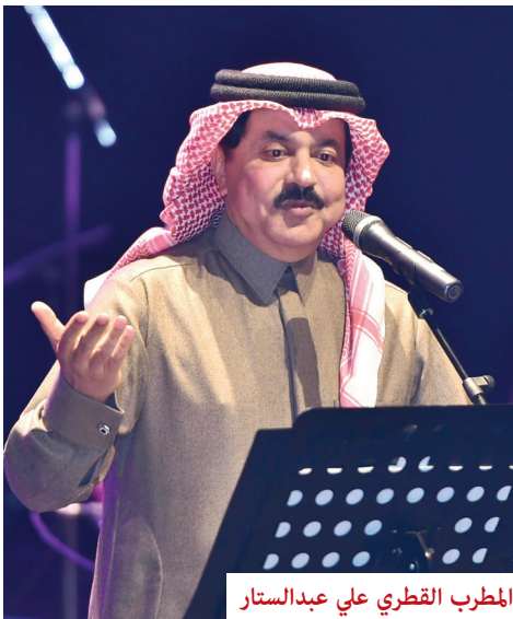
المطرب القطري علي عبدالستار