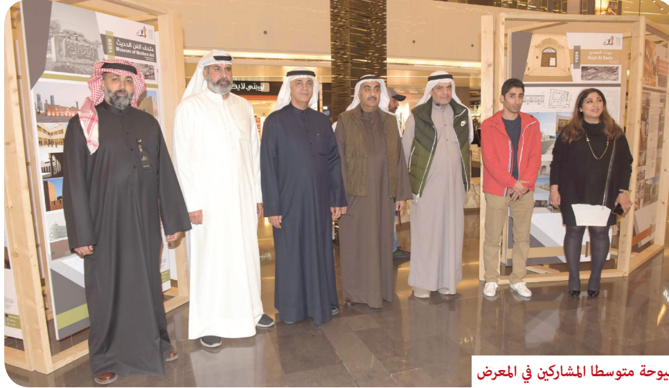
اليوحة متوسطاً المشاركين في المعرض

الكويت ممتلئة بالمباني التاريخية، تلك التي تدل على تميزها الحضاري في مختلف العصور - خصوصاً قبل عصر اكتشاف النفط - وكانت هذه المباني بمثابة رموز واضحة لتاريخ الكويت في هذا المجال، فعلى الرغم من بساطة المواد التي استخدمت في البناء خلال العصور الماضية من تاريخ الكويت، إلا أن المتابع لهذه المباني سيجد أنها التزمت في معظمها بالقياسات والاعتبارات المعمارية الحديثة، مع الحرص على أن تكون مناسبة للأجواء الكويتية، التي تختلف حسب فصول السنة.