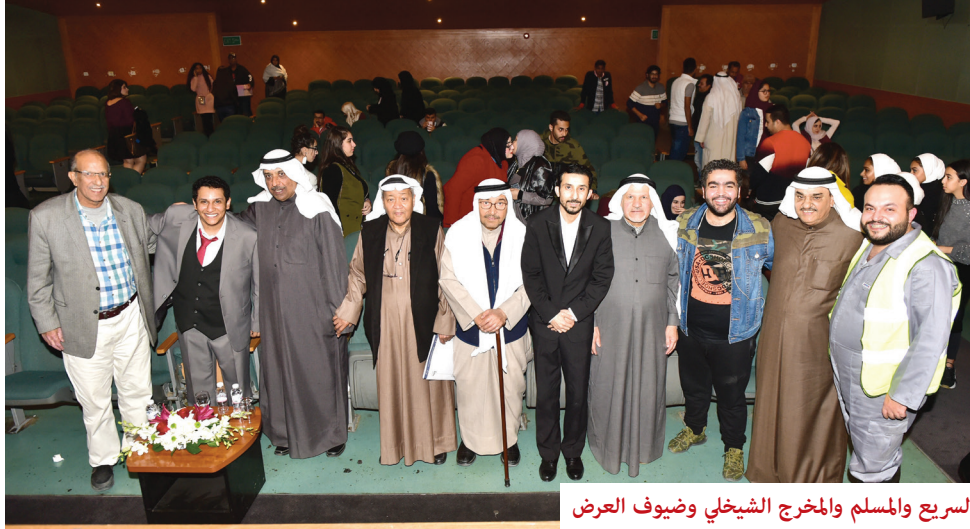
السريع والمسلم والمخرج الشبخلي وضيوف العرض

بممثلات، وهو ما يقلل التكلفة بالتأكيد، ويتمشى مع الطبيعة الهزلية للمعالجة عمومًا. وفي المجمل فإن مقولة العرض واضحة، عالية النبرة، وساخرة، وتتلخص في جملة «الرجل المناسب في المكان المناسب.. حاسب ما شئت فأنت خير محاسب».