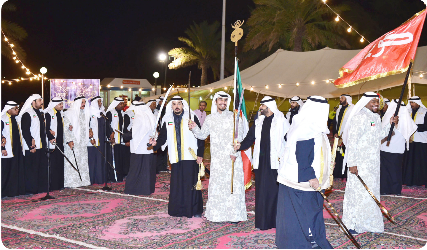
فرقة الجهراء تقدم عروضها