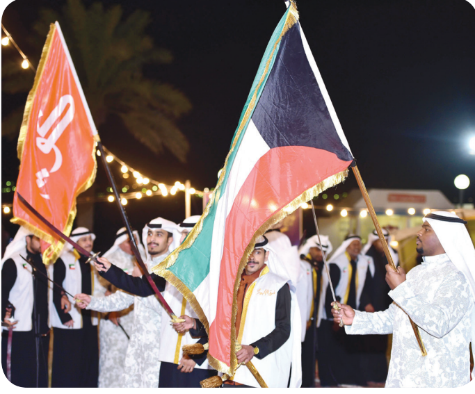
علماء الكويت القديم والحديث