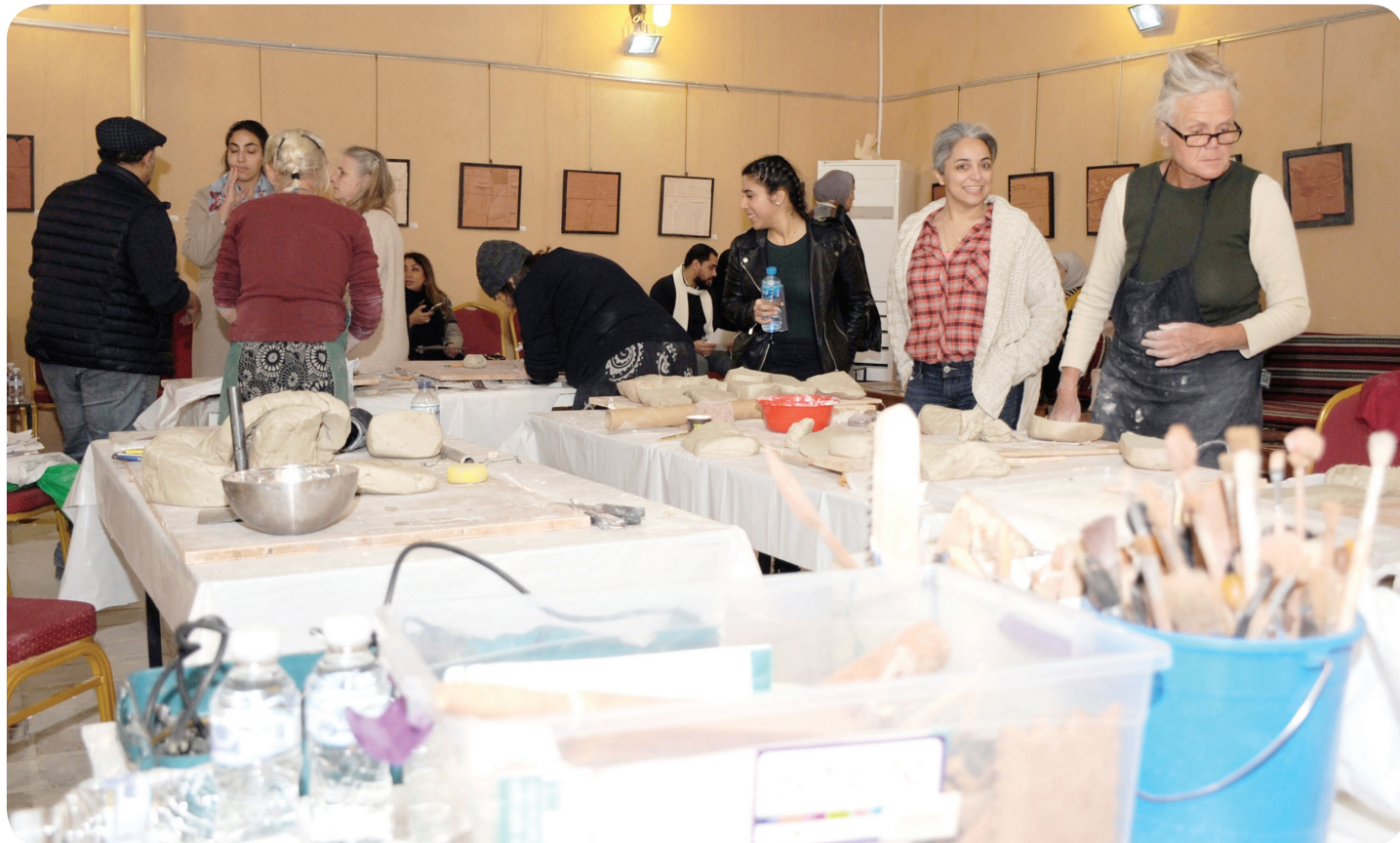
المشاركات في الورشة