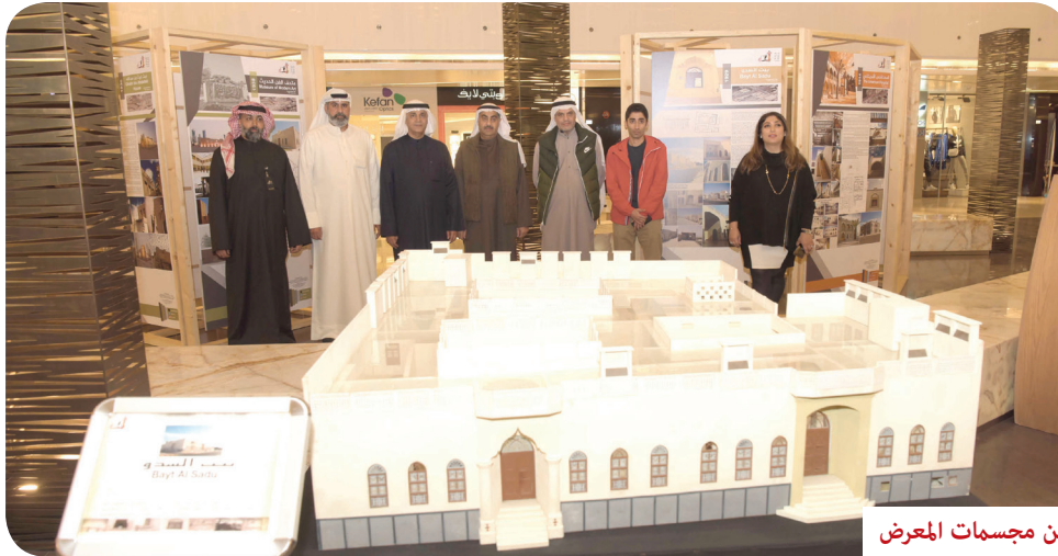
من مجسمات المعرض