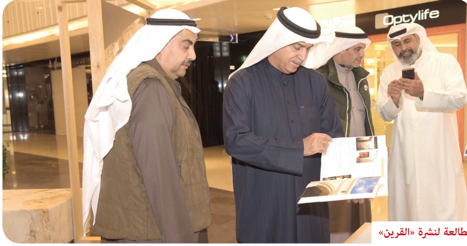
مطالعة لنشرة «القرين»