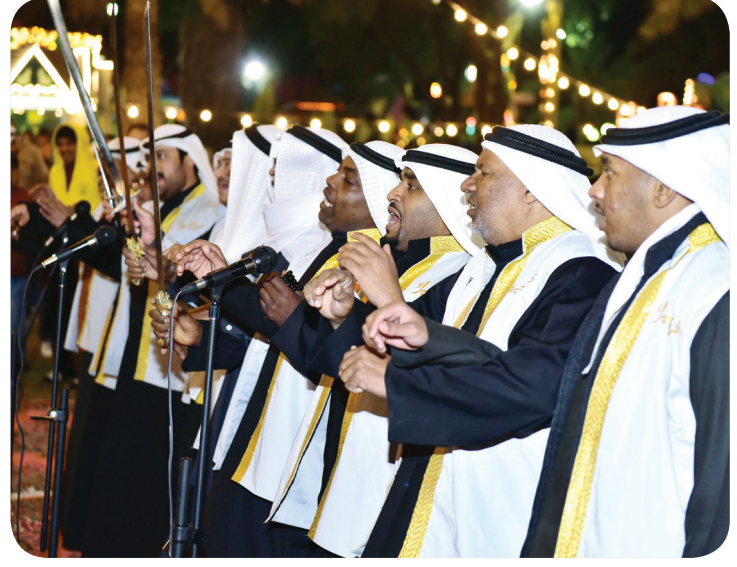
غناء من الفولكلور