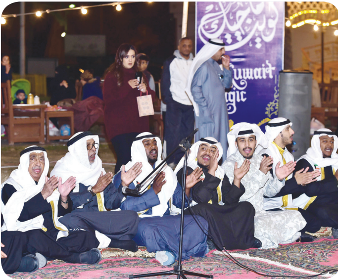
من فقرات الحفل

الجابر الصباح حفظه الله ورعاه وسمو ولي عهده الأمين الشيخ نواف الأحمد الجابر الصباح حفظه الله ورعاه وسمو رئيس مجلس الوزراء. من جهته أبدى محمد العجمي، وهو ممن تابعوا الحفل، إعجابه بالفقرات التي قدمتها الفرقة الشعبية حيث إنها تشكل صورة جميلة لتراثنا الشعبي في الكويت والخليج ويجب أن يشاهد أبناؤنا دائماً مثل