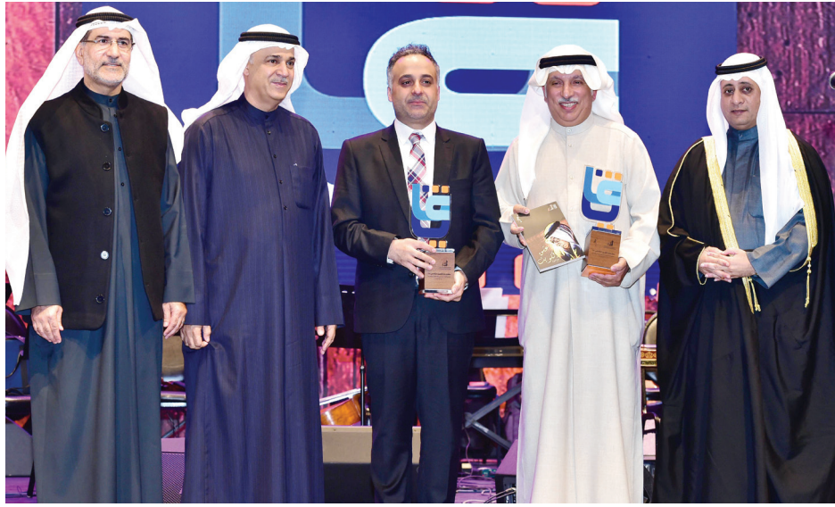
وزير الإعلام محمد الجبري واليوحة والأنصاري والدويش يكرمون المعتوق

مسيرته الفنية على مدى 40 عامًا والتي قضاها في عالم الإعلام والصحافة وكتابة الشعر والتلحين و«جميل أن يتم تكريم الشخص وهو في قمة عطائه».