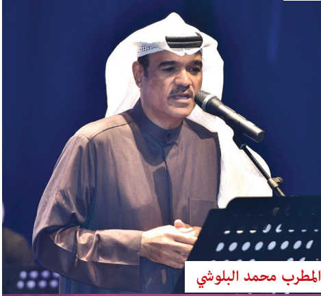
المطرب محمد البلوشي