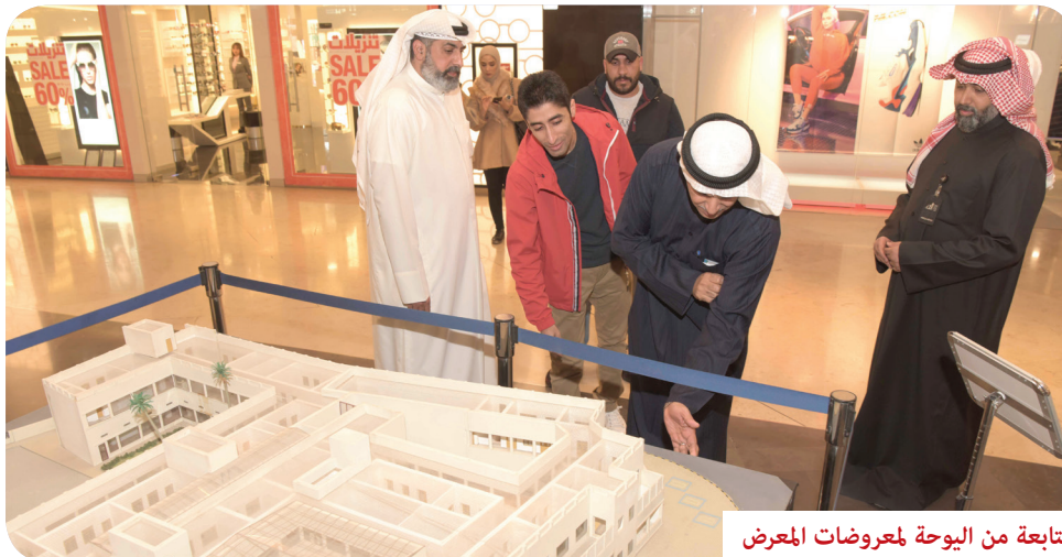
متابعة من البوذة لمعرضات المعرض

الجمهور، ونحرص على إقامة تلك المعارض في المجمعات التجارية حتى يشاهدها أكبر شريحة من الجمهور، فالمباني التاريخية جزء من تاريخ الكويت ونحرص عبر تلك المعارض على ان يتلقى الجمهور المعلومات الصحيحة والموثقة».