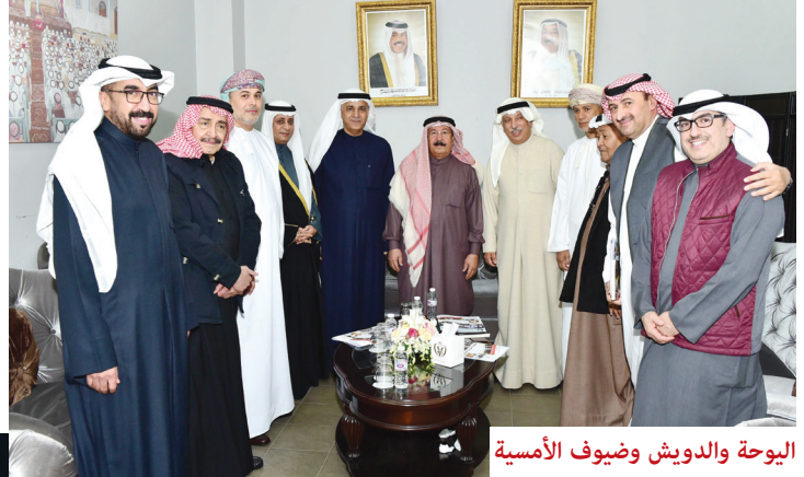
اليوحة والدويش وضيوف الأمسية