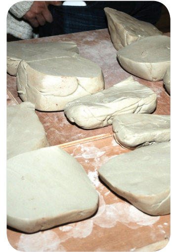
الفنانات الألمانيات تقدمن نماذج عملية