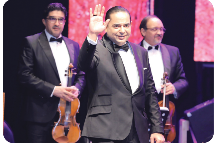
الفنان زياد غرسة

الذي يتميز بحبه للموسيقى». الجدير بالذكر أن الفنان زياد غرسة موسيقار وملحن ومغن تونسي، ولد في 15 مارس 1975 بمدينة تونس، درس عن والده الموسيقار طاهر غرسة، الذي هو بدوره تتلمذ على يد الموسيقار الشهير خميس الترمان الموسيقي التونسي منذ حداثة سنه. تخرج في الموسيقى وهو في سن الرابعة عشرة، ثم أصبح تدريجياً من أبرز مطربي التراث الموسيقي التونسي المألوف والموشحات. يجيد زياد غرسة العزف على العديد من الآلات الموسيقية، كالعود والكمان والبيانو وغيرها.